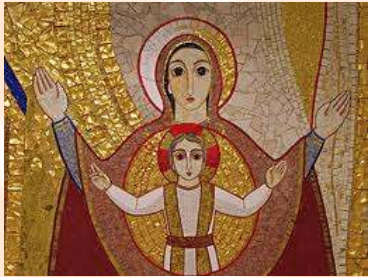
MARIJINA HVALNICA (Lk 1,47-53)

Današnja Božja beseda izpostavi dve veliki ženi; Ano in Marijo. Božja beseda izpostavi njuno veliko hvaležnost Bogu za uslišano prošnjo.