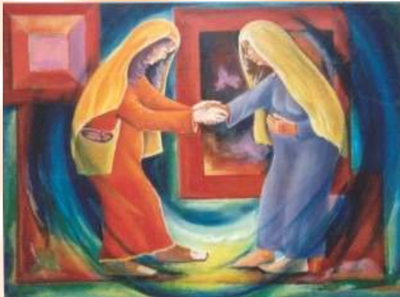
Srečanje Marije in Elizabete

Tiste dni je Marija vstala in se v naglici odpravila v gričevje, v mesto na Judovem. Stopila je v Zaharijevo hišo in pozdravila Elizabeto. Ko je Elizabeta slišala Marijin pozdrav, se je dete veselo zganilo v njenem telesu. Elizabeta je postala polna Svetega Duha in je na ves glas vzkliknila in rekla: »Blagoslovljena ti med ženami in blagoslovljen sad tvojega telesa! Od kod meni to, da pride k meni mati mojega Gospoda? Glej, ko je prišel glas tvojega pozdrava do mojih ušes, se je dete v mojem telesu od radosti zganilo. Blagor ji, ki je verovala, da se bo izpolnilo, kar ji je povedal Gospod!«